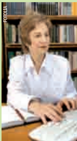
Al lavoro dopo i sessanta. Sopra, due tabelle che riassumono i tassi di occupazione degli over 55 in Europa

E in Italia? Continua ancora Campiglia: «Non ci sono strumenti di gestione per le categorie più anziane. Eppure, i seniors hanno un bagaglio di conoscenze e di esperienze ricchissimo, che dovrebbe essere trasferito ai giovani. Per esempio, impiegandoli come tutori dei neoassunti: oggi si dedica poco tempo alla formazione e loro potrebbero svolgere un lavoro molto prezioso. Ma, in tutto questo c'è anche un altro controsenso: tra gli stessi seniors la pensione è ancora una sorta di mito e l'allungamento della vita